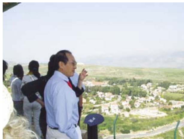
Посол Китая любуется видом города с самого высокого места в городе (650 метров выше уровня моря)