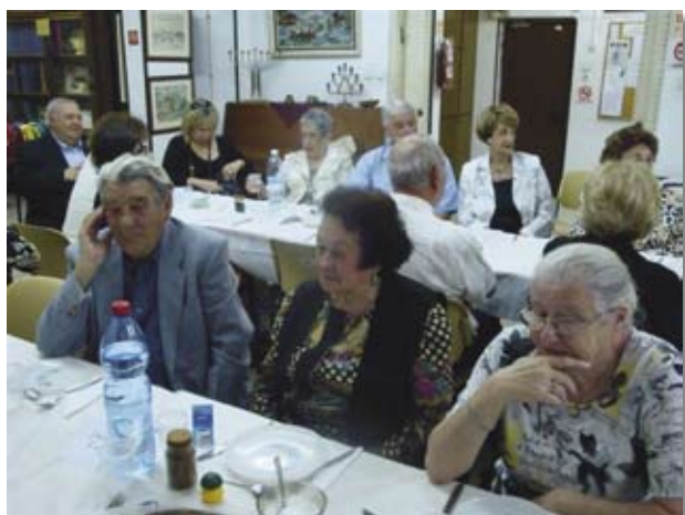
В зале "Бейт-Понве"