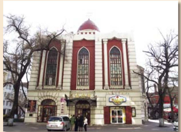
Нили у здания бывшей Главной синагоги