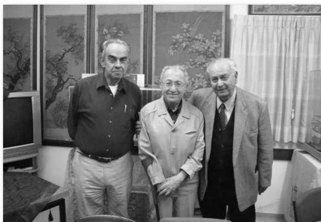
Бывший харбинец, ныне проживающий в Берлине, выдающийся музыкант, скрипач Хельмут Штерн посетил "Бейт-Понве" и встретился с Т. Кауфманом и И.Клейном