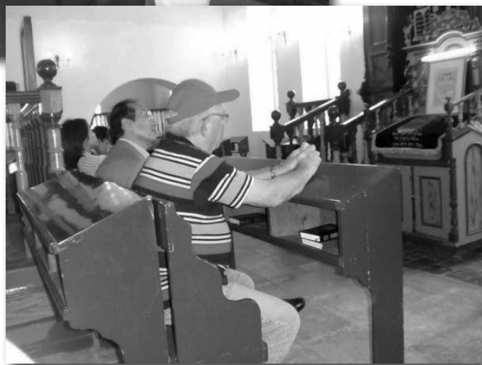
В старой синагоге Рош-Пины. Рядом с послом Рони Вейнерман, организатор поездки