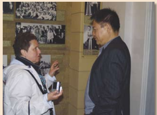
Нили на выставке "Евреи Харбина" в здании бывшей Новой синагоги