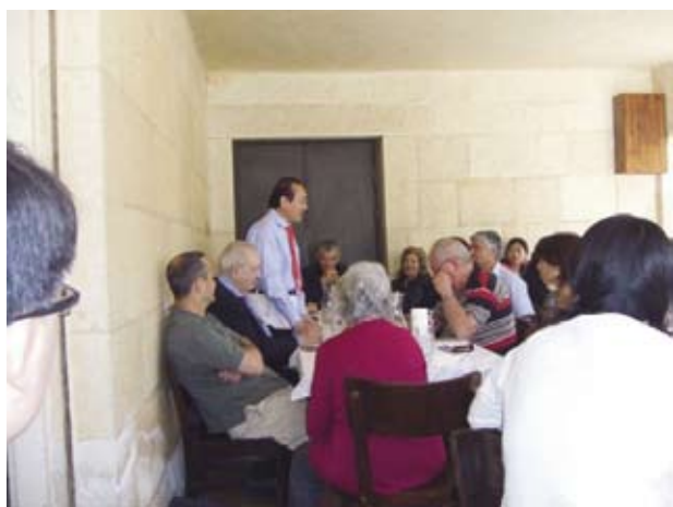
Посол благодарит за теплый прием