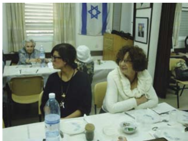
В зале "Бейт-Понве"