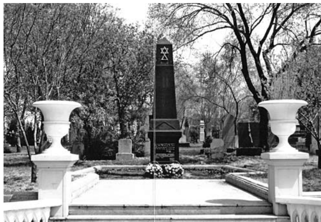
Памятник у входа на кладбище