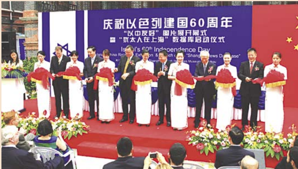
Генеральный консул Израиля в Шанхае Ури Гутман с гостями