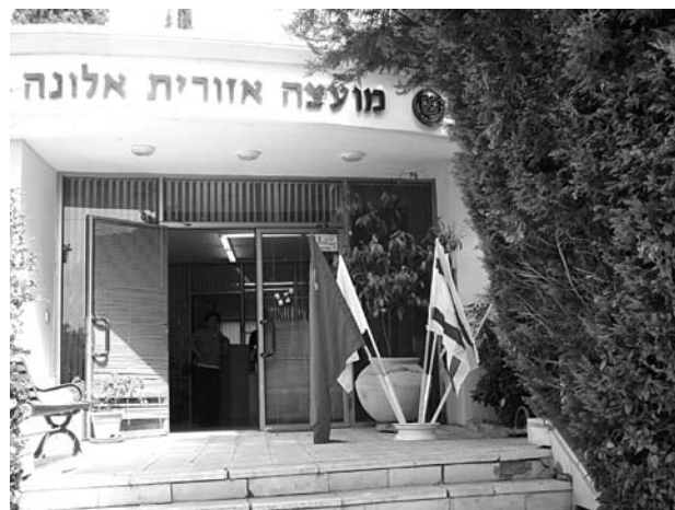
Районный Совет Алона