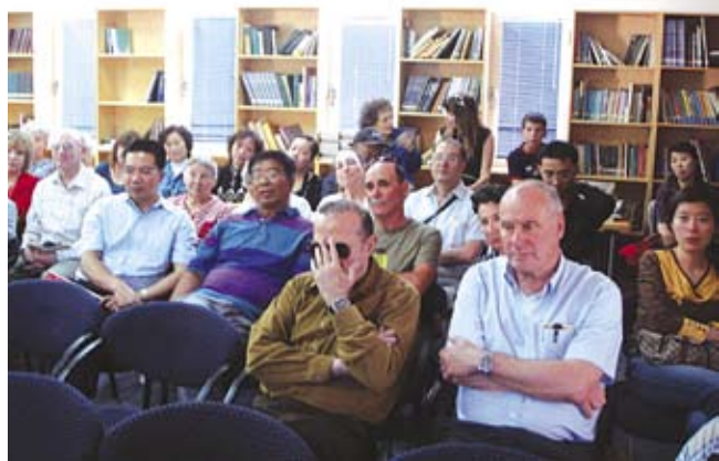
В зале библиотеки