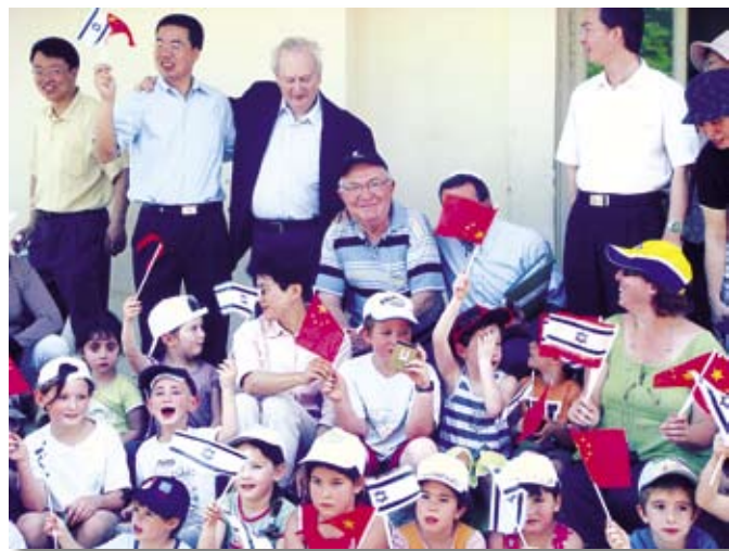
Чины Посольства Китая с детьми Амикама