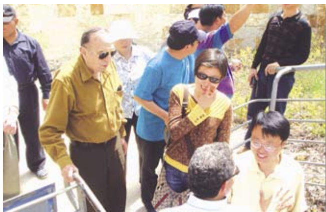
Посещение водопровода Кейсарии