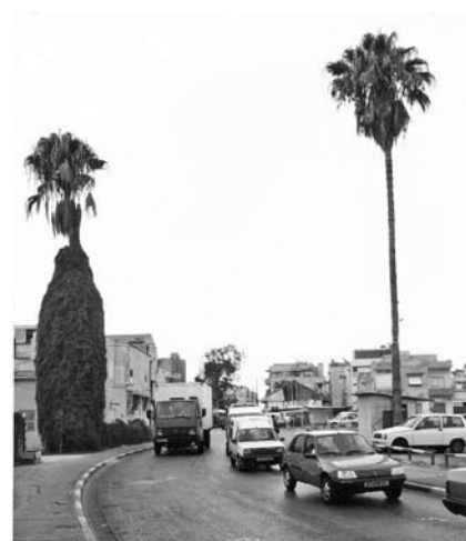
Пальмы, посаженные в 1920 году возле кинотеатра, теперь они украшают перекресток около Новой автостанции Тель-Авива