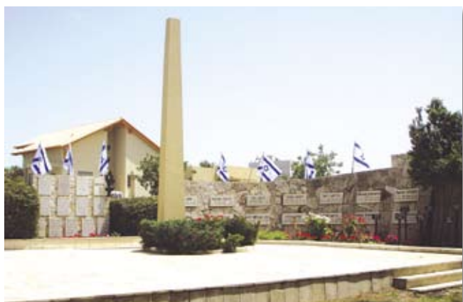
У памятника героям, павшим в войнах Израиля