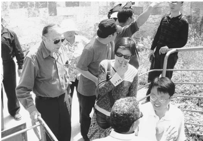
ביקור באמת המים בקיסריה