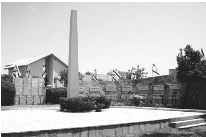
ליד האנדרטה לזכר הנופלים במלחמות ישראל