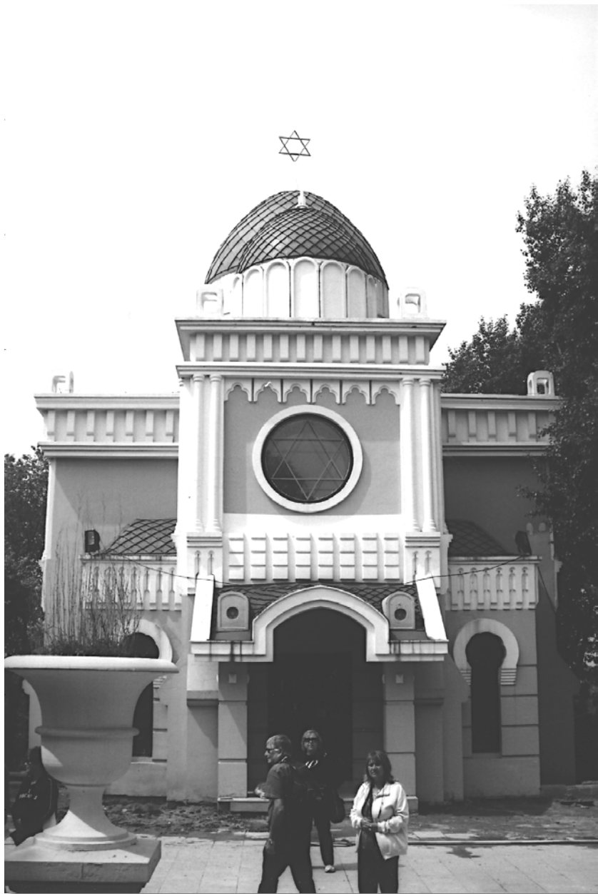
הבניין שהוקם דוגמת בית הכנסת הגדול בחרבין