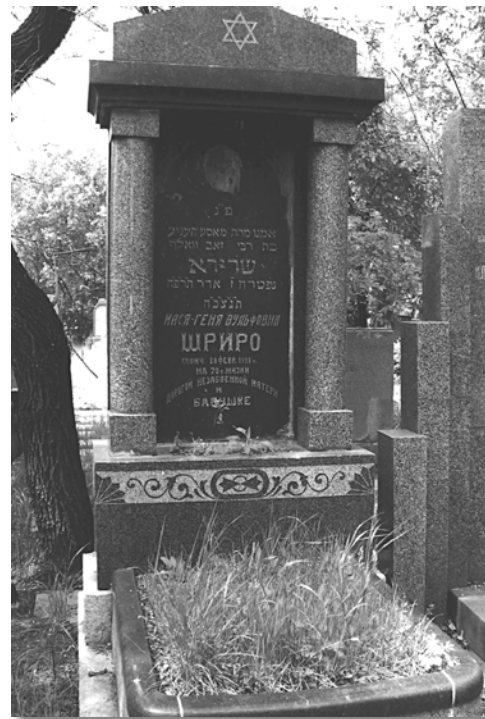
מצבות בבית הקברות