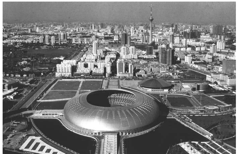
העיר טיאנצין היום

"אנחנו הסינים פתוחים אל העולם - קומוניזם, קפיטליזם, פרגמטיזם - מה זה משנה. הפתיחות שלנו בשנים האחרונות איפשרה לנו ללמוד רעיונות טובים שזרמו אלינו מכל מקום". "הארץ"