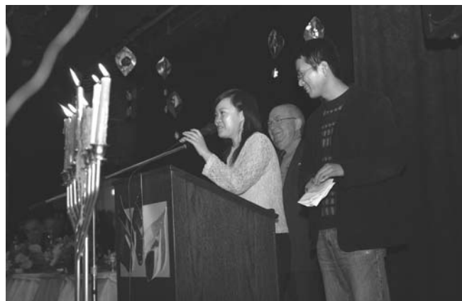
סטודנטים סינים מודים על המלגות שקיבלו