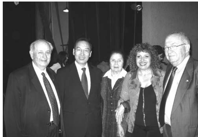
משמאל לימין: ת. קאופמן, שגריר סין בישראל, גב' אורה נמיר, הזמרת אופירה גלוסקא ורוני וינרמן

לימודיהם של הסטודנטים מתרכזים במקצועות הבאים: 5 - אגרונומיה, 1 - מוסיקה, 3 - רפואה, 6 - היסטוריה יהודית, פילוסופיה ודת, 2-שפות זרות, 1-פיסיקה, 3-יחסים בינלאומיים.