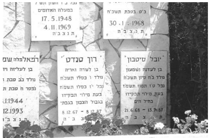
ליד לוח הזיכרון לרון טנדט יוצא סין שנפל במלחמה