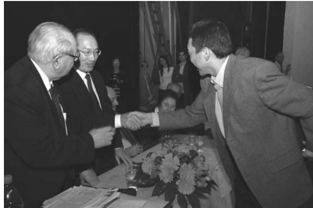
שגריר סין בישראל בחלוקת המלגות