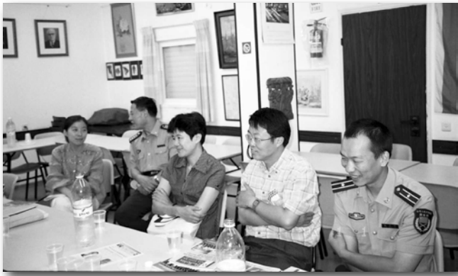
Чины китайского посольства в «Бейт-Понве»