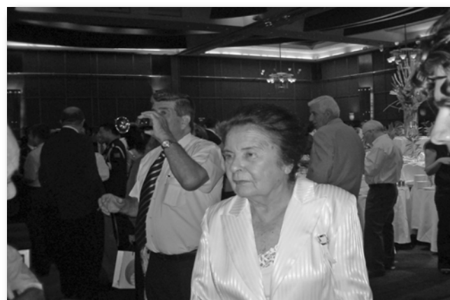
Бывший посол Израиля в Китае Ора Намир и бывший атташе по сельскому хозяйству при посольстве Израиля в Китае Амрам Ольмерт среди гостей