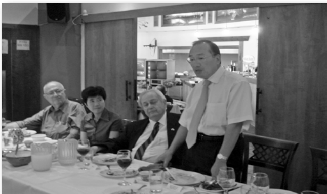
Посол Китая благодарит за прием