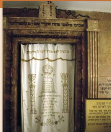
«Арон Кодеи» - Святой ковчег