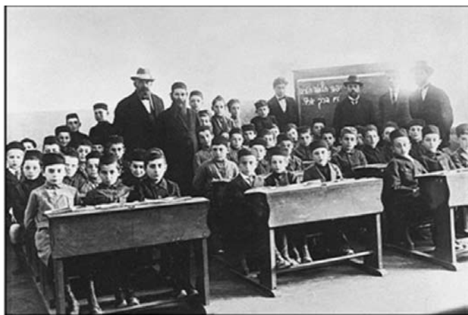
Учителя и ученики в классе. 1922 год