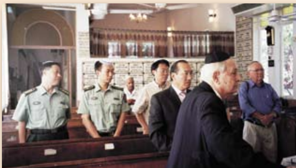
В синагоге во время молитвы