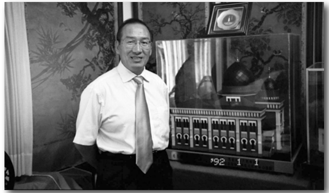
Посол у макета Главной синагоги Харбина