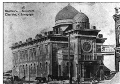
Главная Синагога на углу Артиллерийской и Конной улиц была построена в 1909 году. В 1931 году пострадала от пожара и в ней был произведен ремонт, но в 1932 году она вновь пострадала от сильного наводнения и снова была отремонтирована. Ее закрыли в 1963 году в связи с отъездом из Харбина последних оставшихся в городе евреев. Снимок 1909 года.

Харбин может быть представлен не только как колыбель еврейского прошлого, но и как примечательное место с чисто туристической точки зрения. Ведь мы знаем, что Харбин в этом отношении может предложить туристам много интересного.