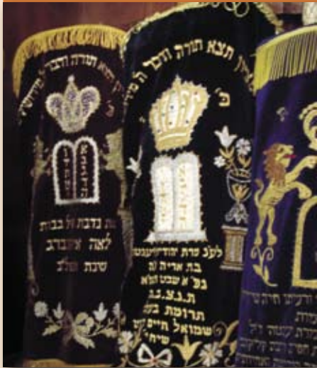
Свитки Торы из Харбина в Святом ковчеге