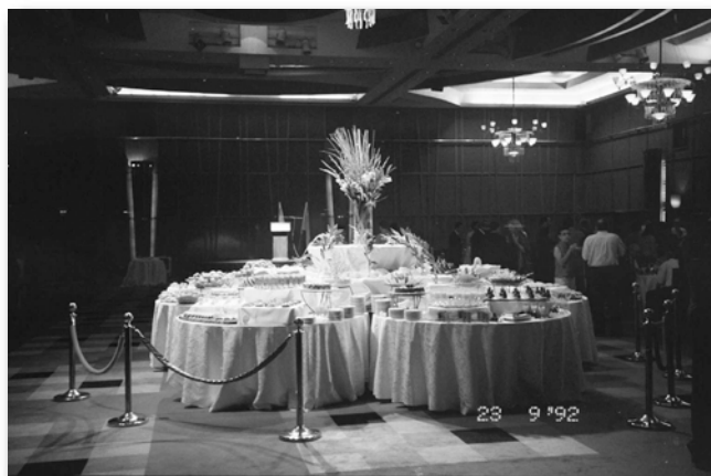
На празднике в зале торжеств