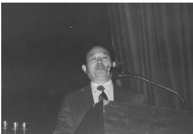
פרופ' סיו סין מאוניברסיטת נאנקינג וראש הפקולטה ללימודי היהדות