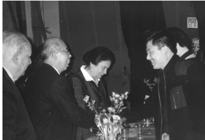
שגריר סין בישראל מר צ'ן יון לון