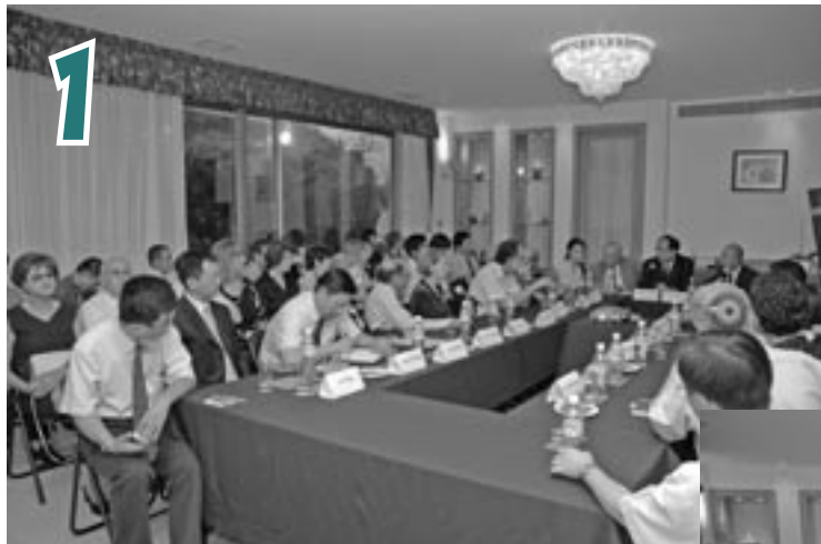
1 מראה כללי של אולם הסמינר